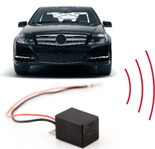
Sender BLINK im Auto